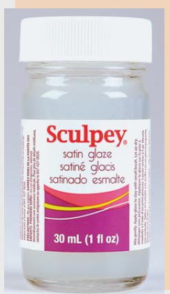
Sculpey Glaze finiša laka plastikai, matēta, 30ml