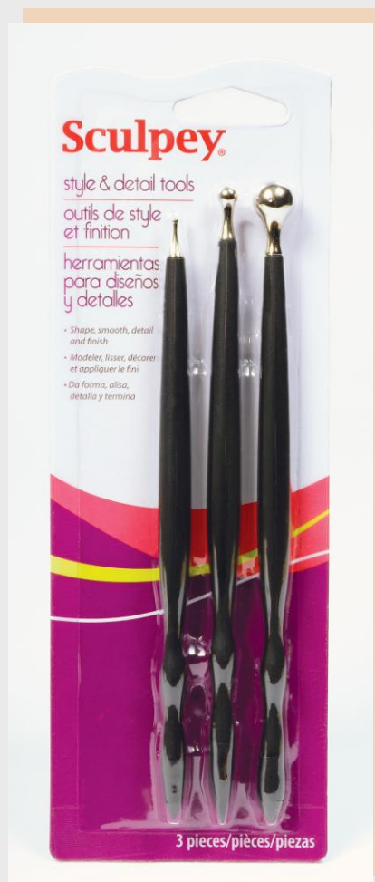
Sculpey instrumenti plastikai ar lodveida uzgaļiem, 3 gb.