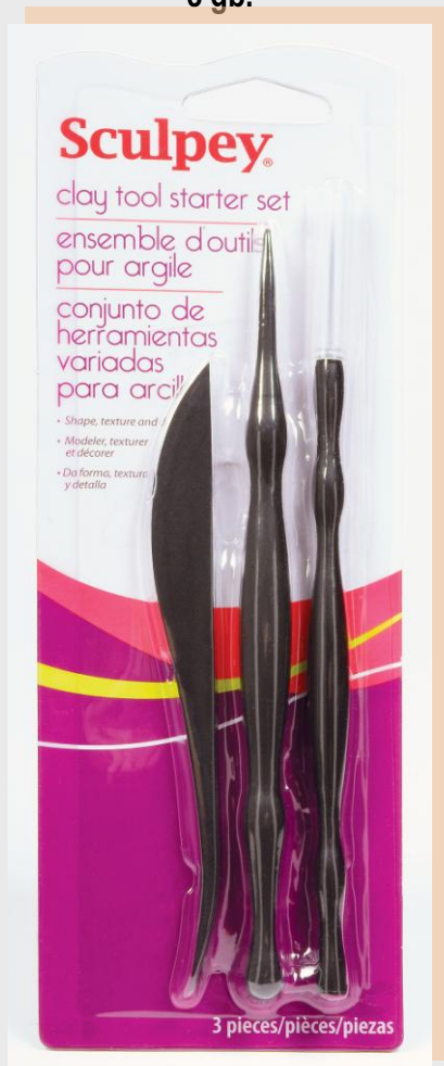
Sculpey instrumenti plastikai dažādām tehnikām, 3 gb.