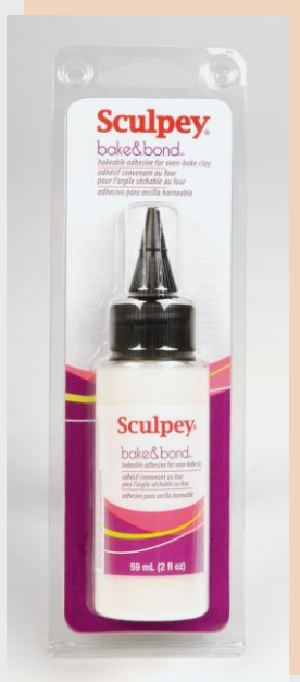
Sculpey termiski apstrādājama līme polimērmālam, 59ml