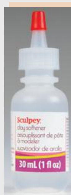
Sculpey līdzeklis polimērmāla / plastikas mīkstināšanai, 30ml