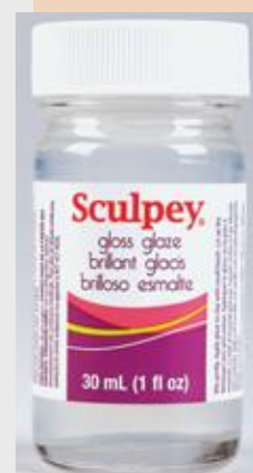
Sculpey Glaze finiša laka plastikai, glancēta, 30ml