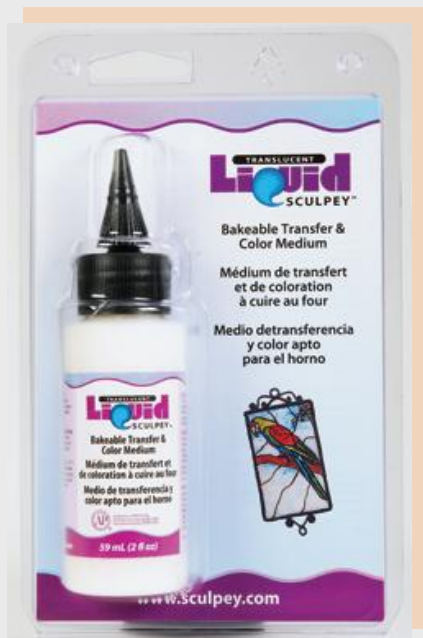
Sculpey šķidrās polimērs bilžu pārvešanai, caurspīdīgs, 59ml