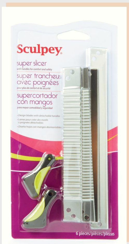
Sculpey Plastikas griešanas instrumenti ar rokturiem, 4 dekorat.naži